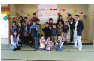
新しいお友達を迎えた歓迎会