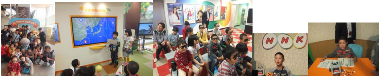
ニュースキャスター、お天気キャスター体験