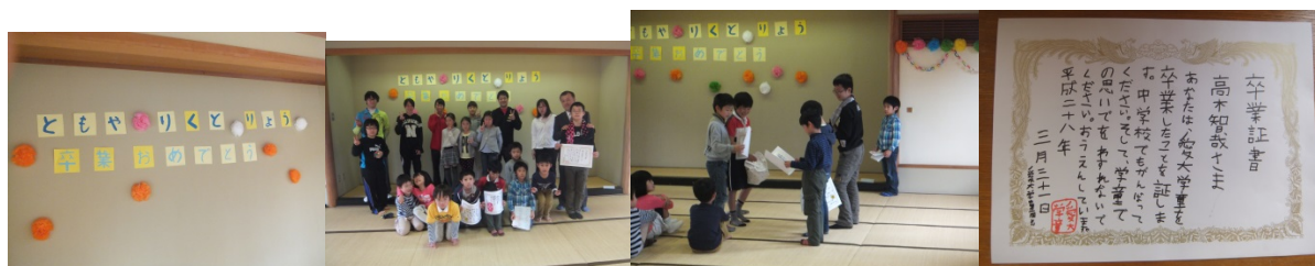
けん玉教室、宿題、トランプ遊びの様子。