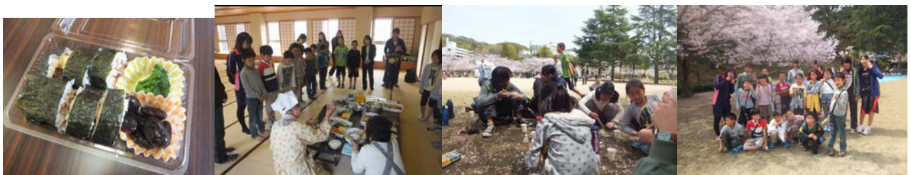
巻きずしの弁当を自分たちで作って、桜満開の道後公園に行きました。