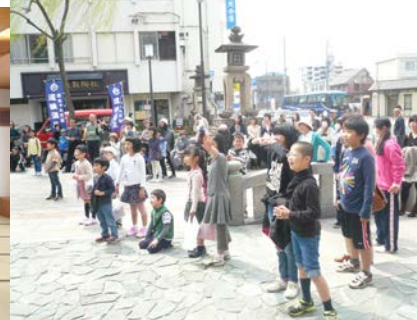
からくり時計に夢中