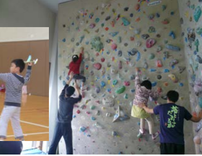
フリークライミングに挑戦