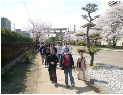
御幸山 ⇒ 出発