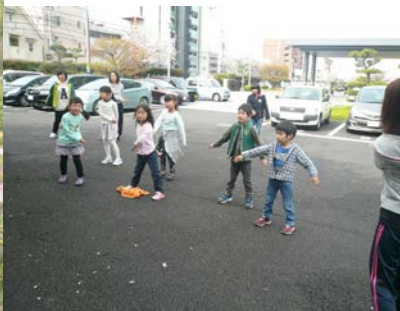
朝のスタートはラジオ体操！