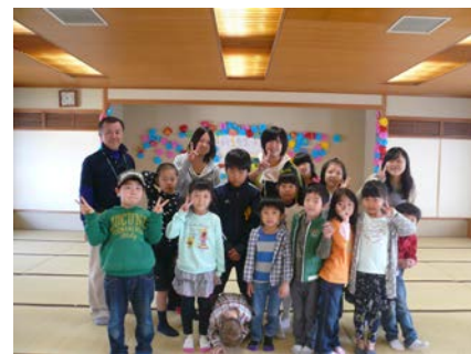
新1年生歓迎会です。