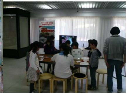
ミュージアム動く恐竜